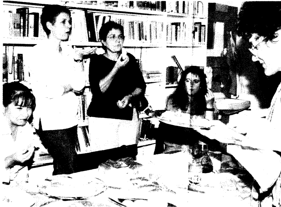
Ah, les petites gourmandes!

Car c'est en effet une véritable soirée de découverte de pains fabriqués ailleurs plutôt qu'ici que proposait Pluri-Elles, association interculturelle de femmes basée dans le Chablais. Et l'idée était plutôt séduisante. Il n'y avait qu'à voir cette vingtaine de dames agiter dans la joie et la bonne humeur autour de l'unique four du local de Pluri-Elles pour s'en convaincre. Des femmes qui, ensuite, ont goûté leurs différentes spécialités, avec leurs invités, avant d'échanger des recettes. Alors, en plus de ceux cités précé-