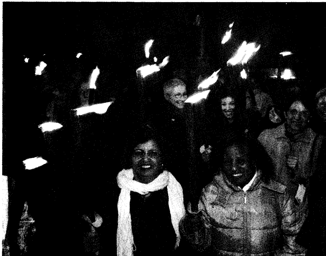
Parties de la place de l'Hôtel-de-Ville, quelques dizaines de femmes ont marché hier soir dans la bonne humeur jusqu'au Théâtre du Crochetan.

» 2e Fête des femmes, vendredi 11 mars à la salle de la gare de Monthey, dès 18 h 30. Au menu: soupes du monde, biodanse, danses orientales, cor des Alpes, tombola. Entrée: 15 francs.